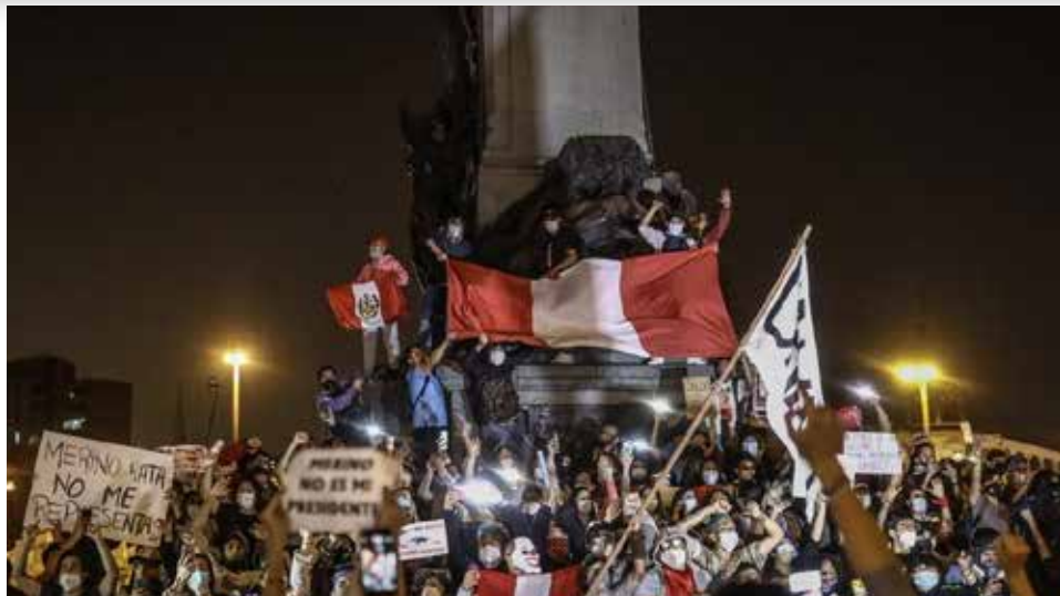
Desde los grupos de poder en el Congreso, se subestimó tremendamente a la población, así como a su fuerza organizativa y de autoconvocatoria y, sobre todo, se supuso que debido a la pandemia, las manifestaciones en contra serían muy limitadas.

Las diversas marchas que llevaron a la renuncia de Manuel Merino modificaron definitivamente el curso tendencial de nuestra reciente historia, y tuvieron como protagonistas a miles de jóvenes a nivel nacional. Por ello, quisiera en este breve artículo ofrecer una reflexión sobre ello de cara al bicentenario. ¿Qué aprendizajes vislumbramos a la luz de lo sucedido?