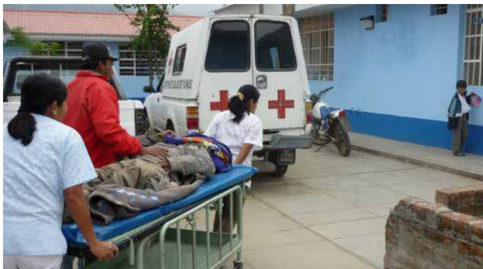
Al reducirse el personal de salud y quedar básicamente gente joven, hizo que la captación de sintomáticos bajara: incluso no hubo ingresos nuevos de marzo a agosto.

De acuerdo a cifras del 2017, solo detrás de Haití (el país más pobre de la región), el Perú con aproximadamente 37 mil pacientes de tuberculosis se posiciona en el segundo lugar con mayor cantidad de enfermos en Latinoamérica.