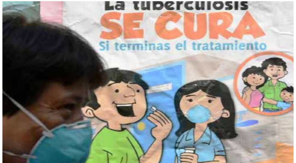
De acuerdo al Informe del Grupo Peruano de Salud Respiratoria (GRUPSAR): "El 2017 el Perú reportó 31,518 casos de TBC."

Podríamos llamar "bueno" el que enfermos de TBC hayan sido captados en las pruebas o consultas por