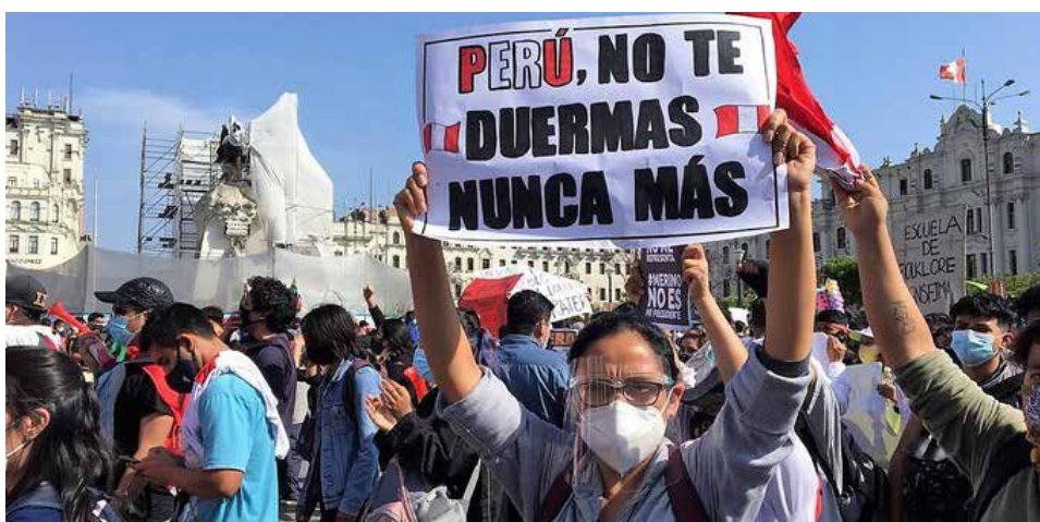
Los jóvenes tienen a su favor la vitalidad propia de la edad, un conocimiento más extenso de plataformas digitales (valiosas hoy para autoconvocarse y organizarse), y un empoderamiento creciente.

con sostenibilidad en el tiempo y que efectivamente impulse cambios estructurales en el país? Los jóvenes tienen a su favor la vitalidad propia de la edad, un conocimiento más extenso de plataformas digitales (valiosas hoy para autoconvocarse y organizarse), y un empoderamiento creciente. Definitivamente han sabido estar a la altura de las circunstancias y son conocedores del poder que significa estar organizados e informados. Cuestión que debe potenciarse continuamente, pero no circunscribirse a marchas, sino a la participación en diversos espacios y canales que la sociedad y el Estado ofrecen o que nosotros podemos generar, donde se promueva la formación y reflexión para conocer mejor la realidad y crear vínculos indispensables para una acción organizada más estable y con continuidad. Esta juventud indignada será la generación del bicentenario solo si logra realmente desatar los nudos que nos impiden avanzar como país, lo cual empieza por conocer las realidades profundas de nuestro territorio y sus problemáticas particulares que mantienen rezagados a millones de peruanas y peruanos.