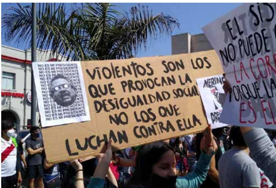
Igualmente me pregunto hasta qué punto avanzarán en autoorganizarse, aceptando los liderazgos y ciertos niveles de representación.

Otra incógnita tiene que ver con su capacidad e interés por ampliar y articular sus organizaciones. Estos jóvenes tienen muchos niveles pequeños de organización para diferentes fines y de hecho las redes representan otro terreno de organización y contactos. Preguntamos: ¿Asumirán mayor presencia en la vida social? ¿Surgirán otras formas de organización? Trajeron novedad y esperamos que si se han manifestado ahora sea para quedarse entre nosotros.