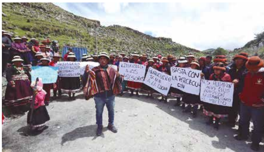
Resolver en gran medida el problema ambiental generado por el transporte minero pasa por asfaltar la carretera y darle permanentemente mantenimiento. El problema es determinar quién lo tiene que hacer.

Fuerabamba es una comunidad que ocupaba lo que es hoy el primer tajo de la operación minera Las Bambas. Esta comunidad tuvo que desplazarse íntegramente para dar paso a la explotación. La empresa se comprometió a darle en compensación 8200 hectáreas de tierras, repartidas en tres partes: las tierras ocupadas por la Nueva Fuerabamba, complejo de viviendas que se ubica cerca de la ciudad de Challhuahuacho, el Fundo Yavi Yavi con 3500 has de tierras para el pastoreo, que se encuentran a más de 100 km de la Nueva Fuerabamba,