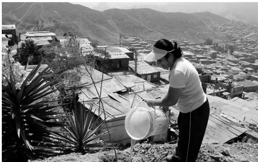
En el caso de los asentamientos urbanos precarios, el panorama de escasez de agua significa para las mujeres redoblar su esfuerzo cotidiano de ir a conseguirla, lo que no siempre se logra.

Nuestro país cuenta con un “Plan de Acción de Género y Cambio Climático” (aprobado el 23 de julio del 2016). Es útil tomarlo en cuenta para exigir su aplicación y su desarrollo por parte de todos los niveles y sectores del Estado. Un punto importante para que este Plan, que incluye un enfoque de interculturalidad, aterrice, es impulsar la revaloración de los conocimientos y sabiduría ancestral de los pueblos andinos y amazónicos y en particular de las mujeres que los conforman, en el manejo de los ecosistemas y de la biodiversidad. Frente a los estragos creados por un modelo depredador de los recursos naturales, esos conocimientos son necesarios y debemos recuperarlos. Sus portadores tienen mucho que enseñarnos para encarar con mayor eficacia los desafíos que nos plantea el Cambio Climático. ■