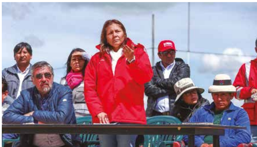
La ministra de Desarrollo e Inclusión Social, Paola Bustamante, anunció que se instalará la mesa técnica de Justicia y Derechos Humanos por el caso del conflicto en Las Bambas

Ante la complejidad de la situación consideramos que lo primero que tiene que hacer el Estado es tratar de entender las distintas tramas que se han venido acumulando. Así como reconocer sus ausencias y errores. Por otro lado, la empresa debería entender que los atajos a los problemas, como propiciar sólo acuerdos económicos y no el restablecimiento de derechos, mantiene la situación de tensión y descontento. Es necesaria una intervención con perspectiva de derechos, que busque profundizar la democracia y que afronte las enormes asimetrías existentes entre los actores. ■