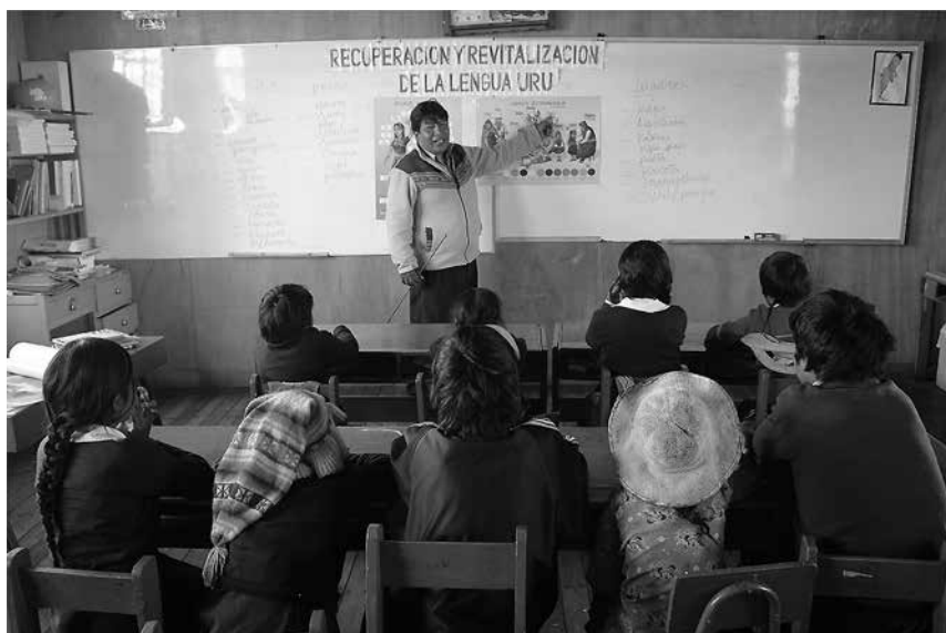
La educación intercultural necesita adoptar una perspectiva crítica que reconozca e incorpore las múltiples tensiones y conflictos que ocurren tanto en el encuentro entre culturas como al interior de cada cultura.