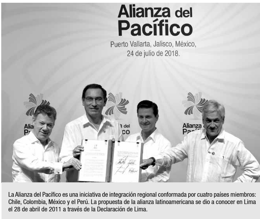
La Alianza del Pacífico es una iniciativa de integración regional conformada por cuatro países miembros: Chile, Colombia, México y el Perú. La propuesta de la alianza latinoamericana se dio a conocer en Lima el 28 de abril de 2011 a través de la Declaración de Lima.

por Luis F. Popa. Analista Internacional y profesor universitario en relaciones internacionales.