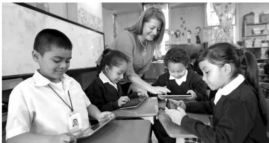
Los colegios católicos también experimentan esta tensión entre migrantes y nativos digitales. He aquí un reto donde debemos preguntarnos si somos capaces de seguir educando en la fe desde lo tecnológico.

El término "nativo digital" es adaptación al castellano del texto original " Digital Natives, Digital Immigrants " de Marc Prensky, donde se describe que los estudiantes del Siglo XXI han experimentado un cambio radical con respecto a sus inmediatos predecesores. Un ejemplo a observar es que los universitarios de hoy constituyen la primera generación formada en los nuevos avances tecnológicos, los que se han acostumbrado por inmersión al encontrarse, desde siempre, rodeados de ordenadores,