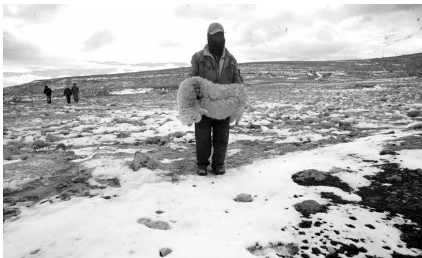
Las principales víctimas del friaje son los niños y adultos mayores. El Estado debe preservar la vida de los ciudadanos peruanos, así como las fuentes de su subsistencia como lo es el ganado camélido.

En los próximos juegos los deportistas participarán en 39 deportes y 57