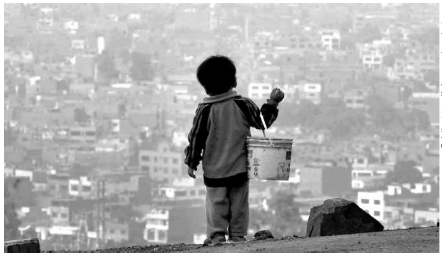
Del 10 por ciento más pobre del país, el 89 por ciento sigue viviendo en casas con paredes, pisos o techos precarios. De ese grupo extremadamente pobre, la tercera parte no cuenta con acceso a agua, mientras el 80 por ciento no cuenta con acceso a desagüe.

Finalmente, un elemento clave del siguiente año será sin duda la reserva moral de los movimientos sociales. De ellos depende el avance de las reformas políticas, sociales y económicas. En tal sentido, el crecimiento sostenible requiere de un país con mejores instituciones, honestas, transparentes y al servicio del pueblo. ■