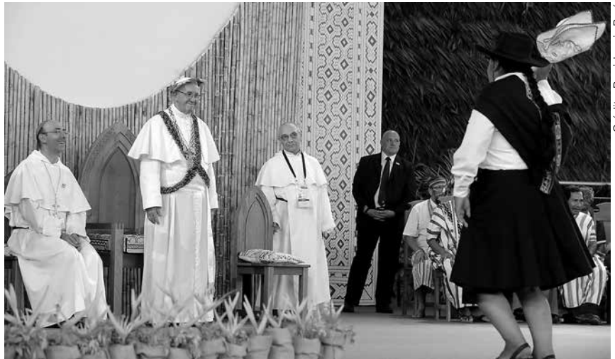
El año 2018 ha sido un tiempo desafiante para la Iglesia en el Perú. La visita del Papa al Perú marcó el inicio del año y planteó desafíos que deben seguir inspirando el discernimiento pastoral.