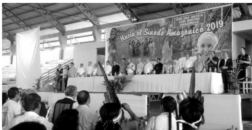
El próximo Sínodo convocado por el papa Francisco para 2019 ha despertado muchas expectativas y esfuerzos, especialmente en los vicariatos apostólicos de la Amazonía peruana.

panamazónica para discutir el documento preparatorio. En el Perú, se han realizado tres de estas asambleas territoriales, cuyo objetivo es elaborar reflexión y propuestas que nutran la asamblea sinodal del próximo año. ¿Cómo las jurisdicciones eclesiales y las comunidades cristianas que no habitan la Selva podemos participar y asumir compromisos concretos por el cuidado de la casa común? Este es un reto que hay que empujar, pues lo que acontece en la Amazonía afecta a todo el planeta. ■