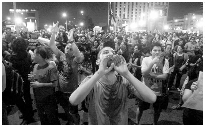
Las marchas, más allá del cierre del Congreso, exigen un cambio estructural del sistema y la cultura de elección de representantes. En lo que va del año se han realizado hasta la fecha cuatro marchas formadas por colectivos ciudadanos.

Actualmente, solo falta una vez más para que, denegando el Parlamento la confirma al gabinete de Vizcarra (ante algún recambio, o la censura al Presidente del Consejo de Ministros), Vizcarra quede expedito para cerrar el Congreso. Mientras, no (sería un quiebre de las reglas democráticas). De darse el cierre del Congreso tal como indica la norma, lo que viene es que se convoque a elecciones de congresistas dentro de los 4 meses siguientes, no siendo posible el cierre en el último año de gobierno. Eso sí, hay que tener claro que si se cierra el Congreso es casi seguro que tendremos en “nuevas” elecciones uno similar: el ordenamiento jurídico para ello es el mismo, y no hay confianza suficiente en los órganos jurisdiccionales que resolverán las controversias. Sólo con nuevas normas, la igualdad de publicidad (y dineros) en la campaña y el voto por conciencia y no dádivas o sentimentalismos, tendremos un Parlamento mejor. Así, las marchas más allá del cierre del Congreso, exigen un cambio estructural del sistema y la cultura de elección de representantes. ¿Es posible? Sí. Debe serlo. ■