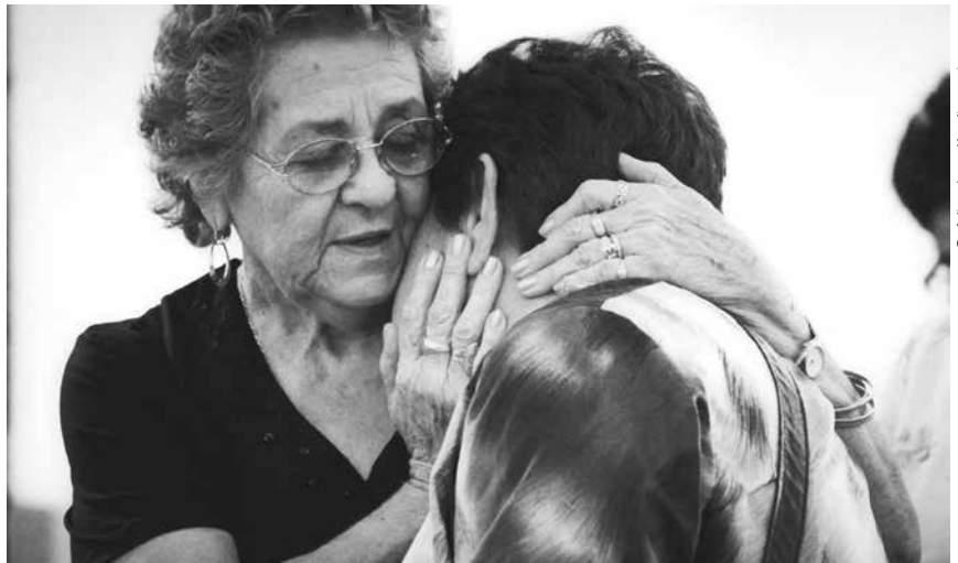
La Exhortación Apostólica Gaudete et Exsultate , aborda el tema de la santidad en medio del mundo. Fiel a su estilo, el Papa escribe sobre la santidad del día a día a la que hombres y mujeres hemos sido llamados.

Este llamado a la santidad no invoca al igualitarismo. No hay un modelo de santidad. La búsqueda de Dios es algo personal, cada uno debe de encontrar su camino y seguirlo. En esta