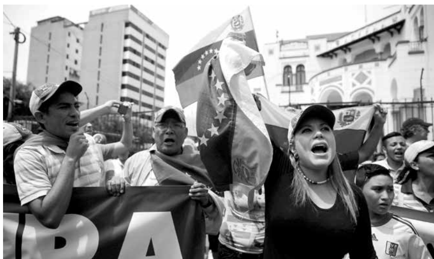
La migración es, quizás, uno de los mayores retos del mundo actual y el debate más cruel, no por las razones de quienes necesitan migrar, sino por quienes imponen su inhumanidad a los migrantes.

Mientras en el Perú, según el Instituto Nacional de Estadística e Informática (INEI) en su informe “Estadísticas de la Emigración Internacional de Peruanos e Inmigración de Extranjeros – 2016” publicado en 2017, se