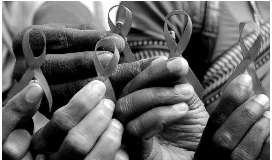
Una pastoral de cercanía con esta realidad ayuda a sensibilizarnos, y así poder disminuir el estigma hacia las personas que viven con esta condición. Una manera de asumir el insistente llamado del papa Francisco de ser una iglesia de "puertas abiertas".

Muchas veces justificamos la discriminación al señalar pecados personales, o justificamos los pecados sociales, y con ello, aislamos a las personas que viven con VIH de nuestras comunidades parroquiales, cerrando las puertas, al contrario de la insistente invitación del papa Francisco a una iglesia de "puertas abiertas"; son contadas las parroquias que supieron acoger a grupos de ayuda mutua brindando el adecuado acompañamiento, y pocas las congregaciones religiosas que asignaron miembros a esta pastoral, aunque el número 421 de Aparecida lo expone como un "deber".