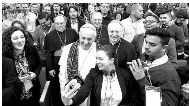
El Encuentro se llevó a cabo en Roma del 18 al 24 de marzo, en preparación de la XV Asamblea General Ordinaria del Sínodo de los Obispos 2018.

pañantes laicos y religiosos para procesos de discernimiento de los jóvenes, la importancia de contar con líderes juveniles que sean reconocidos por sus pares, la apertura al diálogo sobre diversos temas como la diversidad sexual, la vocación de vida y el matrimonio; así como la necesidad de actualización de la Iglesia y su presencia en medios digitales y, sobre todo, la importancia de implicar a los jóvenes en las tomas de decisión de la Iglesia en todos los niveles. ■