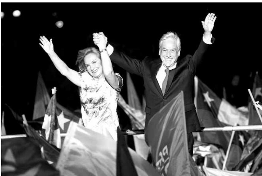
Con el triunfo de Sebastián Piñera se ha conformado un triángulo "neoliberal", junto a Macri en Argentina y Temer en Brasil, gobernando tres de los países claves de Sudamérica.