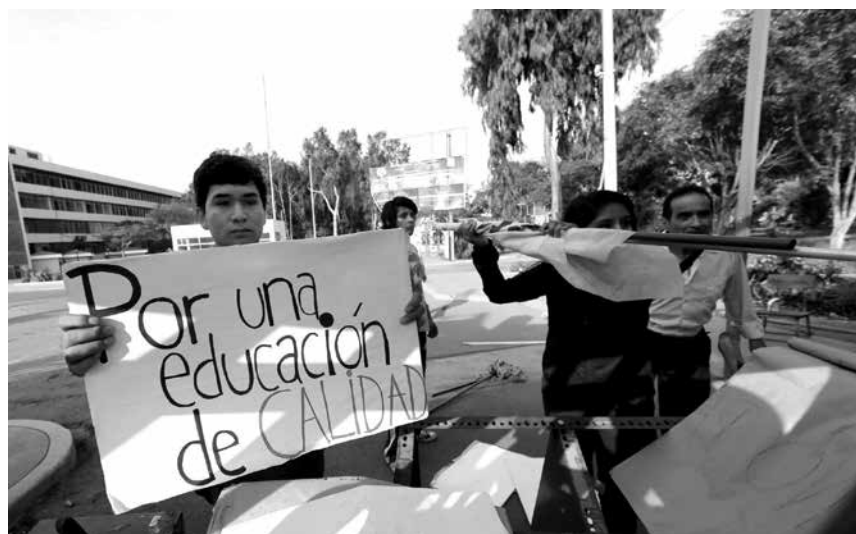
Los conflictos deben ser atendidos por los medios recogiendo no sólo la versión de las autoridades o el sector privado, sino la de los afectados. Estos desencuentros sociales deben ser explicados en su integridad, dándoles voz a estos últimos.

En cualquiera de estos conflictos, los grandes medios se han puesto más