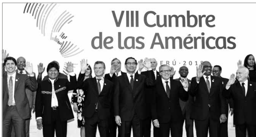
La VIIIa. Cumbre de las Américas terminó con la suscripción del Compromiso de Lima. Mediante el citado documento, los países del hemisferio se comprometen a aplicar medidas concretas para el combate a la corrupción.

integridad y transparencia en el sistema judicial (punto 2), desarrollo de una cultura de transparencia (punto 4), garantía en la transparencia e igualdad de oportunidades en los procesos de selección de servidores públicos (punto 9), en la promoción de códigos de conducta para los servidores públicos que contengan altos estándares de ética, probidad, integridad y transparencia (punto 11) y demás. Un tema pocas veces señalado al abordar la temática de la corrupción y que el Compromiso de Lima recoge es el reconocimiento de los aportes de los pueblos indígenas y comunidades afrodescendientes para mejorar la transparencia de la administración pública (punto 6). A pesar de la amplia presencia del tema de la transparencia en el citado documento, los medios de comunicación no han enfatizado lo suficiente este hecho. Podría concluirse entonces que la Declaración de Lima es una llamada a la transparencia del sector público, por medio de la cual se resalta la importancia del acceso a la información administrativa y a su escrutinio público. ■