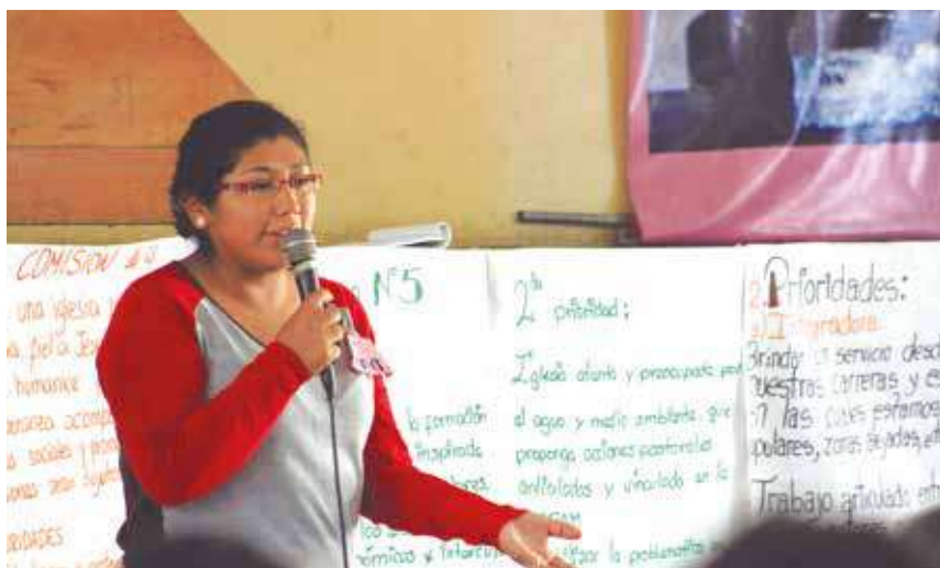
Los cursos recibidos en la Escuela Hugo Echegaray fueron enriquecedores, además de dejarnos nuevos retos desde las regiones y con las personas con las que trabajamos. En la foto, mi participación en uno de los trabajos grupales sobre la Iglesia y sus retos.

Tuve la oportunidad de conocer la Escuela de Líderes Hugo Echegaray a partir de los comentarios de exalumnos, y de lo muy fructífero que fue para ellos ser parte de la escuela. Un internado de 15 días en Lima con per-