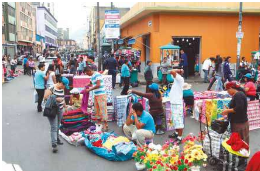
Las cifras de la informalidad laboral en el Perú son contundentes: 11,7 millones de personas, que representan el 72% de la Población Económicamente Activa (PEA).

La primera movida fue cuando los economistas neoclásicos (los economistas clásicos consideraban que el pleno empleo era una condición natural del capitalismo) comenzaron a sostener que el empleo era una demanda derivada de la inversión privada, y por lo tanto se podía eliminar de las ecuaciones macroeconómicas. La tributación es también una variable derivada, pero nadie la ha puesto en un segundo plano. La segunda movida fue cuando los economistas neoliberales, encabezados por Milton Friedman, echaron abajo todas las políticas regulatorias y promotoras del Estado que propuso John Maynard Keynes y aplicó Franklin Roosevelt, incluyendo al principal objetivo