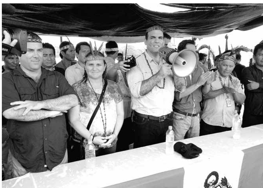
Con los acuerdos firmados en la Mesa de Diálogo Político Intercultural en Saramurillo, Loreto, se logrará el desarrollo sostenible de las comunidades indígenas de las cuencas de Pastaza, Corrientes, Tigre, Marañón y Chambira. Zonas afectadas por los constantes derrames de petróleo.