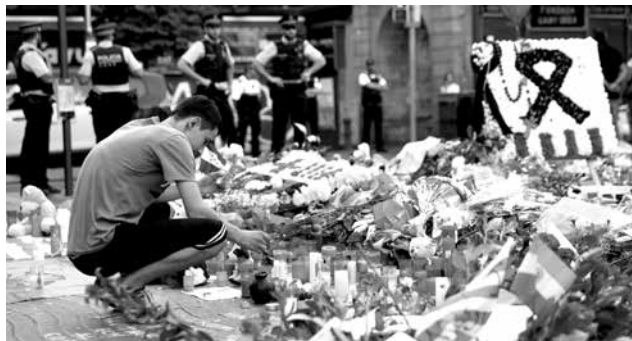
Que lo sucedido en España no nos paralice y nos encierre, sino que por el contrario nos permita mirar con agudeza la terrible situación de violencia que estamos viviendo.

Es entendible la postura que llama a la gente a no tener miedo, aduciendo que ese es el objetivo de los violen-