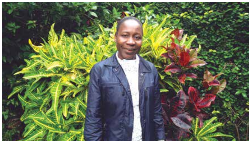
El Señor ha querido que yo esté aquí para que comparta mi fe y mi vocación misionera comboniana con el pueblo peruano.

Nuestro carisma es exclusivamente misionero (ad Gentes). Las palabras de nuestro fundador a través de las cuales el Señor tocó mi corazón, fueron: "Áfri-