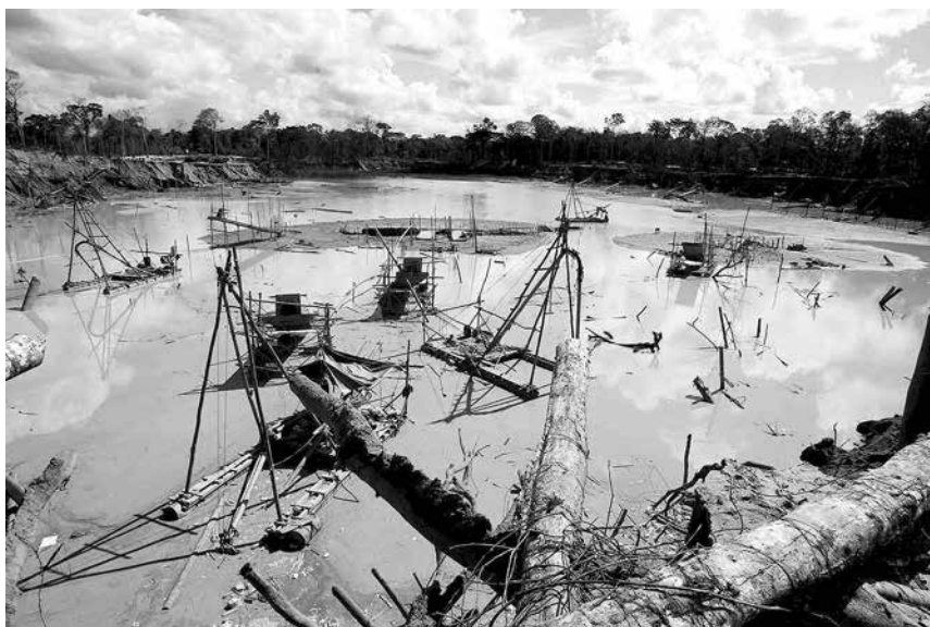
Madre de Dios se ha vuelto una de las regiones con mayor conflictividad social. Actividades como la extracción del oro vienen arrasando con la Amazonía y la vida de muchas personas.

El Papa Francisco, desde su calidad de visitante ilustre, podrá denunciar fenómenos humanos y sociales que afectan nuestra sana convivencia y