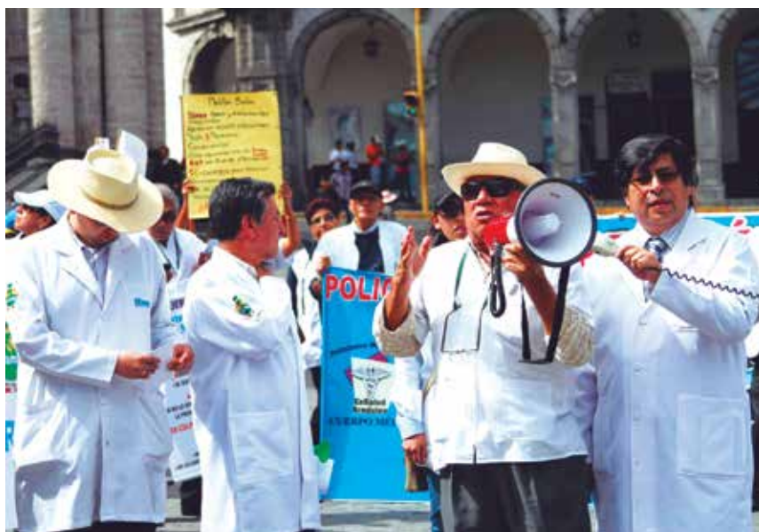
Durante el mes de julio se realizó la huelga médica a nivel nacional, que tuvo como reclamos el alza de salarios, la mejora de infraestructura y la compra de insumos para la atención médica. Aún sus reclamos siguen sin ser atendidos

El Gobierno de PPK recibió el sector salud con un presupuesto de 13400 millones de soles para su ejecución en 2016. La propuesta de su plan de gobierno señala expresamente que se aumentará el 0.5% del PBI cada año, es decir unos 3500 millones de soles. Esto se incumplió para el presupuesto 2017, que a pesar de haberlo encontrado avanzado la gestión actual, pudo haberse modificado para al menos llegar a la mitad de ese monto; sólo se incrementó en 300 millones de soles, menos de la décima parte de lo ofrecido.