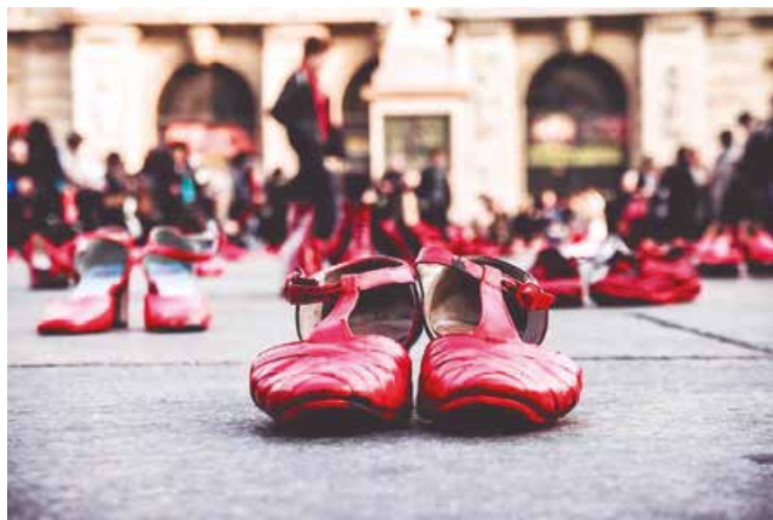
Según cifras oficiales del Ministerio de la Mujer, los casos de feminicidio del 2019 son más que los del año anterior.