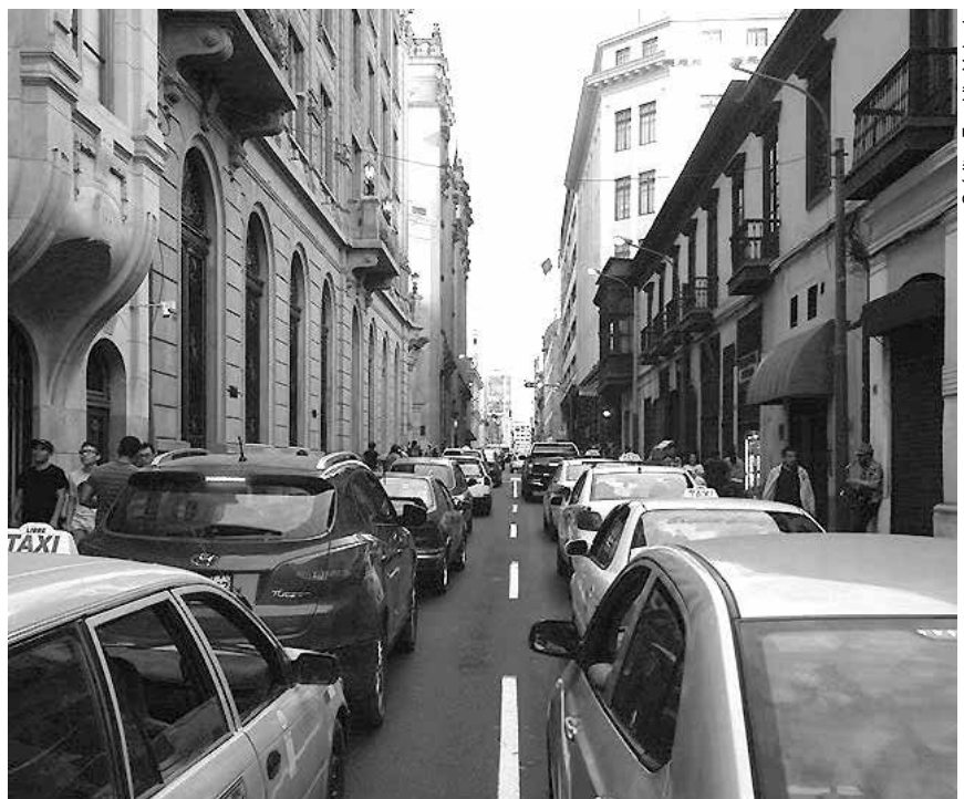
La congestión vial y la presencia masiva del auto privado en la ciudad también es culpable de los altos índices de contaminación del aire.

La ciudad debe ser pensada desde la diversidad de personas que la habitan, garantizando la seguridad y disfrute de los ciudadanos sin distinción de edad, identidad de género, nacionalidad, etnia y diversidad funcional. Construir una mirada común, plural e interdisciplinaria sobre lo que deseamos y necesitamos en nuestros espacios públicos, hará que éstos sean más representativos, inclusivos, diversos y accesibles. Nuestras calles son los espacios que protagonizan las transformaciones urbanas, y debemos pensarlas desde un urbanismo ciudadano que coloque a las personas en el centro de la planificación de la ciudad. ■