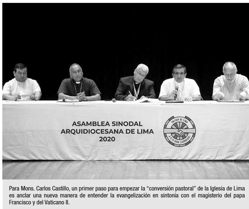
Para Mons. Carlos Castillo, un primer paso para empezar la “conversión pastoral” de la Iglesia de Lima es anclar una nueva manera de entender la evangelización en sintonía con el magisterio del papa Francisco y del Vaticano II.

El primer domingo de Adviento, en diciembre 2019, marcó el inicio de un “camino sinodal” de la Iglesia en Alemania, que se prolongará por dos años. En una situación inédita, la convocatoria y la organización están a cargo del Comité Central de Católicos