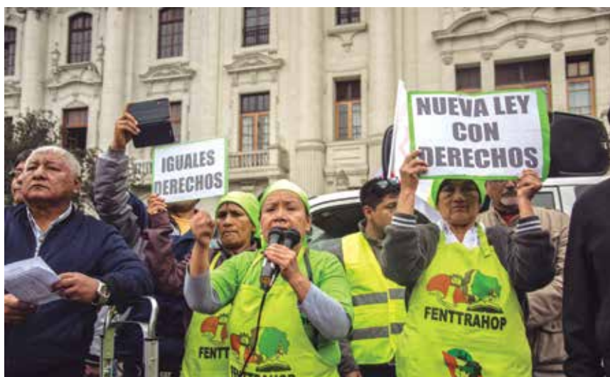
Lanzamos juntas la campaña "Cocinando una nueva Ley con derechos laborales". Esta campaña la hemos retratado mediante una receta que tiene como ingredientes: contrato por escrito, libertad sindical, seguro y pensión, regulación de agencias, jornada de 8 horas, seguro de salud en el trabajo, etc.