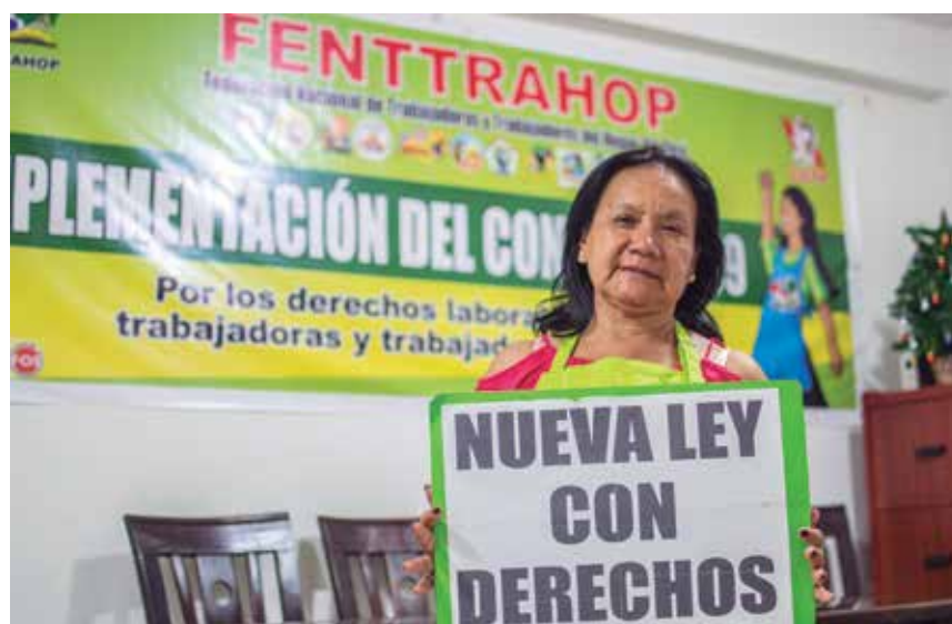
Han pasado 16 años desde la promulgación de la Ley 27986. Esta ley es la que actualmente rige y nos coloca en estas situaciones de discriminación y desigualdad en comparación con los demás trabajadores.

Han pasado 16 años desde la promulgación de la Ley 27986. Esta ley es la que actualmente rige y nos coloca en estas situaciones de discriminación y desigualdad en comparación con los demás trabajadores. Hoy formamos parte de los regímenes especiales, es decir, nuestra condición de ser trabajadoras del hogar y mujeres del cam-