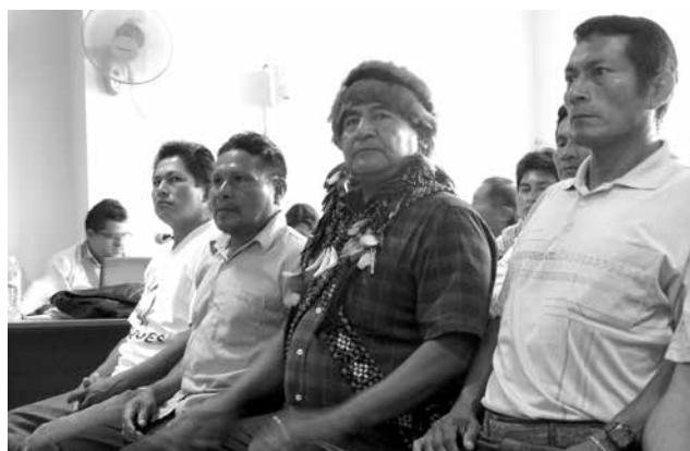
La Iglesia Católica y las instituciones de DDHH siguen acompañando el calvario de los procesados, cumpliendo el compromiso de darles el apoyo humanitario y la defensa hasta que se haga justicia.

La Iglesia católica y las instituciones de Derechos Humanos siguen acompañando el calvario de los procesados, cumpliendo el compromiso de darles el apoyo humanitario y la defensa hasta que se haga justicia. En cada aniversario del Baguazo, Mons. Santiago García de la Rasilla y su sucesor Mons. Alfredo Vizcarra han escrito una carta pastoral que es una valiosa ayuda para seguir solidarizándonos con el sufrimiento de nuestros hermanos, para confiarle al Señor de la vida lo que está por resolver y para que nunca más tengamos que vivir una historia como esta. ■