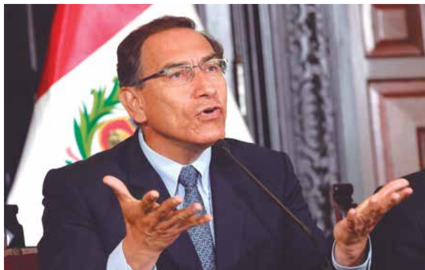
La reforma política tiene que ver con el sistema de partidos políticos, el sistema electoral y las relaciones entre el Ejecutivo y el Congreso. Hoy se vive un ambiente de tensión que ha llevado a plantear "cuestión de confianza".

mandato. El mandato de Vizcarra es continuidad del de PPK, en cuyo periodo ya el Congreso rechazó una cuestión de confianza, por eso, si la rechaza esta vez procede el cierre del Congreso. Solo quedaría funcionando la Comisión Permanente.