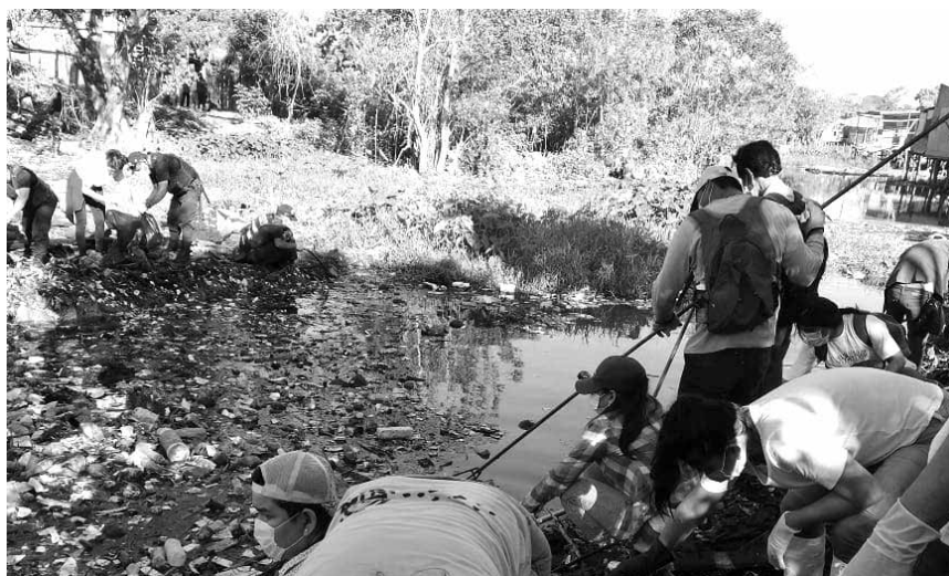
La Laudato si' nos invita a generar un cambio de actitudes y a vivir en armonía con la madre naturaleza. En la imagen un grupo de organizaciones sociales lideradas por jóvenes logró sacar más de 25 toneladas de basura acumulada en la quebrada Yumantay, Pucallpa.

por las autoridades me han permitido ver los deseos de superación de muchos jóvenes, que reclaman mejores servicios y en su mayoría los servicios referidos a educación, lo que evidencia que cada vez son más los jóvenes en la Amazonía que buscan sacar del abandono a la tierra que los vio nacer. Eso no se limita a ser profesionales exitosos, ningún proyecto puede ser eficaz si no está animado por una conciencia formada y responsable. El reto que debemos asumir los jóvenes por la defensa de la Amazonía es tener conciencia de que la tierra es un verdadero tesoro que hay que valorar, que urge un compromiso real de cuidarla, de no utilizarla como un objeto descartable, hay que disfrutarla sin necesidad de romper esa relación de armonía. Seamos jóvenes dinámicos y hagamos parte de nuestra vida la defensa de la casa común, utilicemos nuestra energía por puro agradecimiento, acudamos al llamado agonizante de la tierra por instinto y con pasión, que a nuestra edad tengamos más claro que nuestros gobernantes y políticos la urgencia de generar un cambio. ■