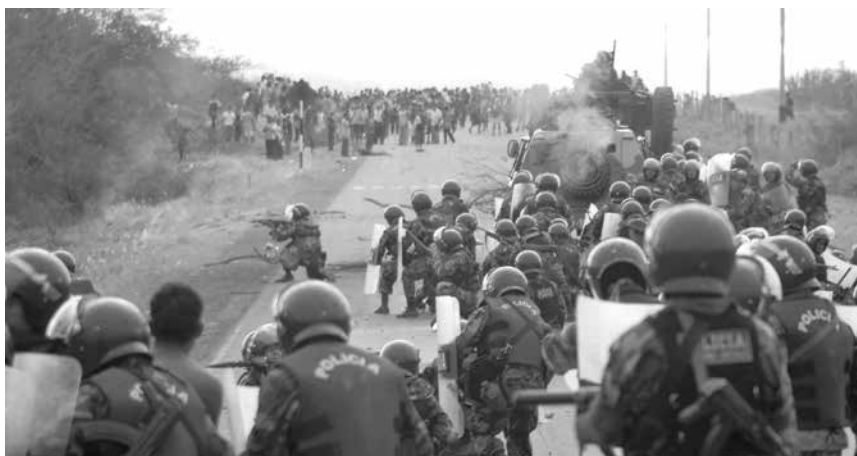
El ‘Baguazo’ se originó porque el segundo Gobierno de Alan García promovió una política de inversiones como parte de la ejecución del Tratado de Libre Comercio con Estados Unidos. Los decretos legislativos suscritos afectaban directamente a las comunidades indígenas de la Amazonía.

Radio Marañón del Vicariato Apostólico de Jaén, junto con otros medios locales como Radio La Voz de Bagua Grande, entrevistaban a los dirigentes para que explicaran las razones de su reclamo; este apoyo ayudó a que las poblaciones aledañas tomaran conciencia de que la causa de los Awajún y Wampis era justa y decidieran darles el apoyo. Es así como las organizaciones sociales de Bagua, Utcubamba y Jaén hicieron coordinaciones con las parroquias para darles a los manifestantes el apoyo logístico que necesitaban.