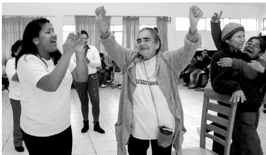
Celebración del Día Nacional de la Persona Adulta Mayor, CAR Cieneguilla ubicado en el Callao, Agosto 2018.