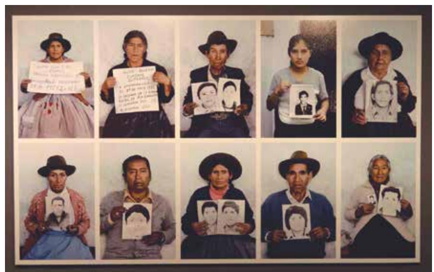
Hay una enorme deuda que se plantea como reto para un país que camina hacia el Bicentenario.

Si no entendemos, como país en general y como funcionarios y gobierno, en particular, la enorme deuda que se tiene con las víctimas y la necesaria atención a cada uno de sus derechos de manera urgente, este proceso de reconocimiento no será completo y seguiremos postergando una obligación, causando más daño y afectación a quienes ya se les hizo daño, de manera directa o con la indiferencia de muchos años. Hay una enorme deuda que se plantea como reto para un país que camina hacia el Bicentenario. ■