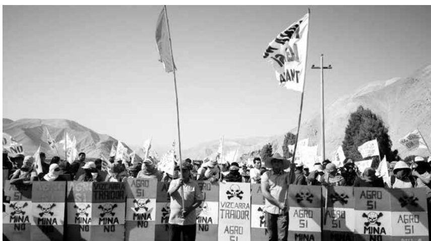
Ante las reacciones suscitadas por el Proyecto Tía María, la Presidencia de la Conferencia Episcopal Peruana expresó su preocupación ante el posible agravamiento de esta situación, y compartió su esperanza de que un diálogo oportuno pueda evitar un nuevo conflicto social.

Es claro que los agricultores, en su gran mayoría, no quieren que Southern opere en la zona, en realidad se han negado de tajo a que se ejecute el proyecto desde el inicio del mismo: nueve años de protestas, idas y venidas dan fe de ello. Las razones son varias: la primera, y puede ser la más importante, es que el valle de Tambo tiene como actividades más importantes la agricultura y la pesca, es un valle productivo y que ha permitido que sus pobladores mantengan una calidad de vida adecuada. Ellos no quieren cambiar su estilo de vida, y se sabe que una mina daría un giro de 180°, arruinando sus cultivos, trayendo mayor contaminación y otras