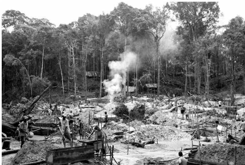
El Sínodo es un proceso caminante de todo el pueblo de Dios, que parte de la reflexión de un tema importante para la iglesia. El Papa nos pide poner atención en la tragedia y el desastre ecológico que se vive en la región amazónica.

El tema de la tribulación con relación al poder. En el Nuevo Testamento, esta cuestión se refiere tanto al sufrimiento físico como a una "etapa de tinieblas", durante la cual reina la desesperanza. Aquí se coloca la idea de la destrucción de la Amazonía. Este proceso que es entendido como rechazo del amor de Dios, a su gratuidad, pero es más que esto, es tribulación