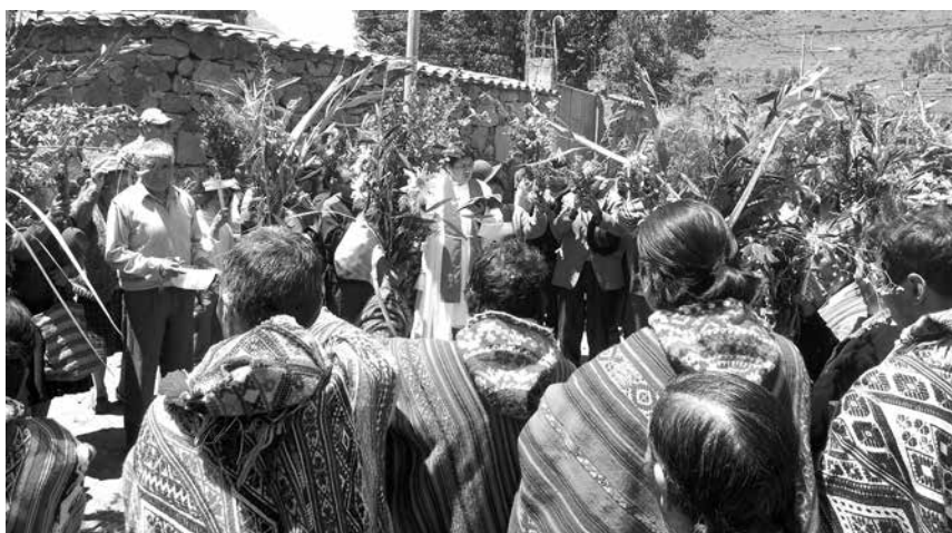
La Semana Santa es una fecha muy representativa en Perú, este acto conmemorativo es percibido y vivido de distintas formas al interior del Perú, pues la diversidad cultural y geográfica genera prácticas particulares tanto en los Andes como en la Amazonía peruana.

La alteridad u otredad es comprendida como un principio sobre el cual aparecen diferenciaciones entre los individuos, es decir, los unos y los Otros. José Matos Mar se había referido a ese otro Perú, como el Perú migrante que sale de sus regiones y se moviliza por necesidades laborales,