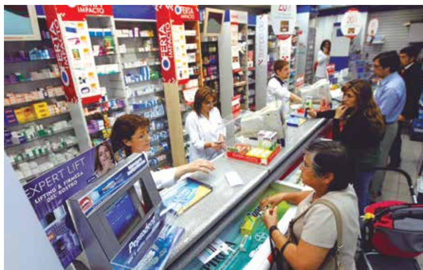
Durante la implementación del AUS se puede apreciar una externalización de servicios de forma reactiva, poco planificada y con deficiente control (boticas privadas “FARMASIS”, atenciones de emergencia en clínicas privadas, el “negociazo” del caso Moreno). Se externalizó, no buscando más eficacia y eficiencia, sino para evitar contratar directamente más personal.

Es necesaria una amplia reflexión sobre el diseño e implementación de la política del AUS antes de seguir profundizando sus ejes de “reforma”. Consideramos que esta política no encontró el nudo decisivo para desarrollar una reforma en el sector salud. Los interesados en las políticas de salud nos debemos a la tarea de seguir las experiencias exitosas como el caso de la “reforma de la salud mental”: esta política estableció una reconfiguración de la dimensión programática de la salud mental, estableció como finalidad el logro de resultados sanitarios privilegiando la efectividad, garantizó a nivel legislativo los derechos de las personas con problemas de salud mental, logró articular la eficiencia asignativa mediante el mecanismo de presupuestos por resultados y viene expandiendo la oferta pública de servicios de salud mental mediante un modelo de atención comunitaria. La lección está dada, cambiar la vieja manera de producir salud para garantizar su acceso universal es posible y es más necesario que nunca. ■