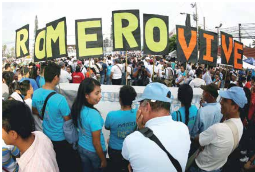
La iglesia universal está de fiesta con Mons. Romero, su palabra profética nos interpela, su vida y ejemplo son vigentes, por eso, podemos decir con alegría evangélica que no sólo es San Romero de América, sino San Romero del Mundo.

La iglesia universal está de fiesta con Mons. Romero, su palabra profética nos interpela, su vida y ejemplo son vigentes; por eso, podemos decir con alegría evangélica que no sólo es San Romero de América, sino San Romero del Mundo.■