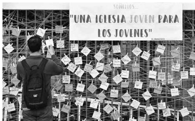
Trescientos cuarenta participantes de todo el mundo, se dan encuentro en Roma del 3 al 28 de octubre para reflexionar y poder brindar mayores luces a Su Santidad en este camino de una Iglesia joven y misionera.

La sala Paulo VI en Ciudad del Vaticano está lista para albergar a los 340 participantes sinodales que tendrán cada uno 4 minutos, durante todo el Sínodo, para poder