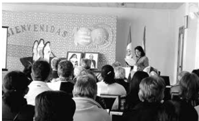
Crédito: Zully Rojas