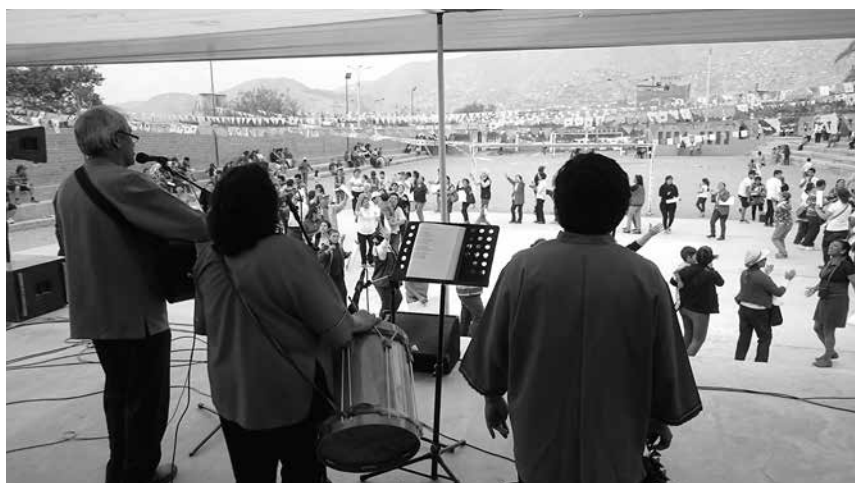
Canciones como “Antes de formarte...”, “No se puede sepultar la luz”, han servido para hacer presente al Dios de la Vida. Esto ha sido el trabajo del Grupo Siembra, agrupación cultural de canto popular. Su música dialoga con lo social, acompañando y animando la vida de muchas comunidades cristianas.

Canciones como “Antes de formarte...”, “No se puede sepultar la luz”, “Caminando va”, y tantas otras, han servido para hacer presente al Dios de la Vida escribiendo la historia con su pueblo. Esto no siempre ha sido bien visto por quienes tienen el poder, se sienten amenazados cuando hay una voz que clama en nombre