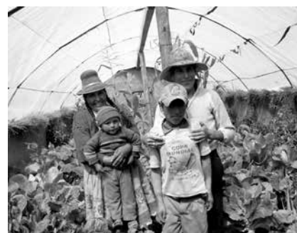
La ley de agricultura familiar busca mejorar la vida de las familias que dependen de la agricultura.

Para ver esta entrevista, ingresar al canal de Youtube: https://www.youtube.com/InstitutoBC ■