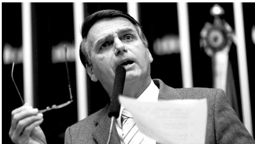
Jair Bolsonaro es el electo presidente del Brasil, postulando por su Partido Social Liberal. Logró el triunfo pese a un lenguaje xenófobo, homofóbico, racista y además amenazando su retirada de los Acuerdos del Cambio Climático de París.