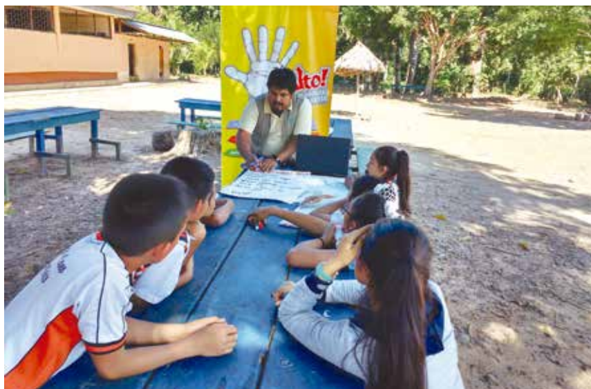
Soy nacido en la “Ciudad de las Orquídeas”, Moyobamba, lugar en donde radico y trabajo actualmente. En esta foto estoy reunido con los estudiantes de las clases al Aire de Libre de la I.E. Juan Guillermo Castillo Delgado - Distrito Caynarachi - Provincia de Lamas.

Puedo afirmar que hay un sin número de posturas sobre ello; desde mi punto de vista, siento que cada postura es fundamentable y debatible pero, ello no significa que mi postura tiene que superar o sobreponerse sobre la postura del otro. Para el caso de género , mis apuntes se resumen en que: “...la perspectiva de género busca compren-