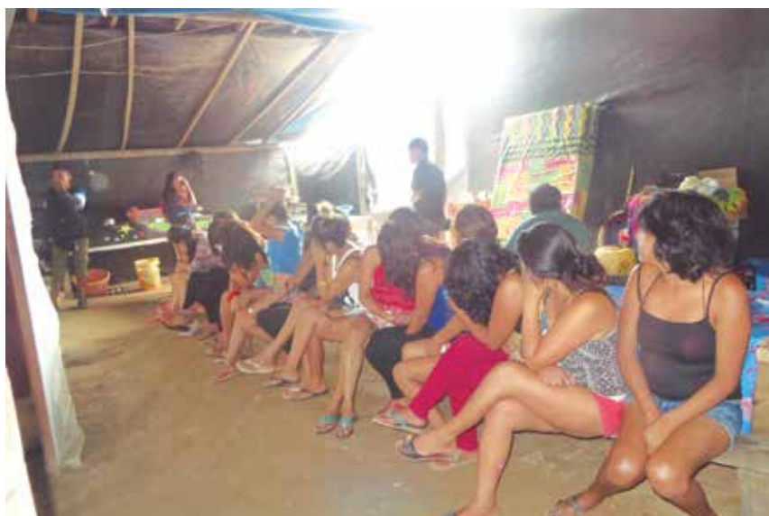
El departamento de Madre de Dios, por su asociación con la minería ilegal, es el lugar donde la trata de personas muestra su rostro más cruel alrededor de los lavaderos de oro. Lugares como La Pampa o La Rinconada se han convertido en tierra de nadie.

Este ejemplo evidencia la magnitud de la explotación sexual en esta región e interpela al Estado y su respuesta: en una región con más de 420 "prostibares" y 4.500 víctimas, ¿son suficientes 4 policías y 3 fiscales especializados en trata de per-