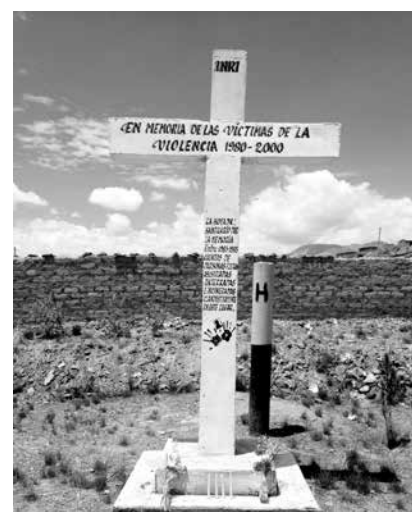
En el Perú, el Estado rememora ciertos lugares, pero no genera esa carga afectiva con el espacio. (Foto de la La Hoyada - Ayacucho).

Para ver esta entrevista, ingresar al canal de Youtube: https://www.youtube.com/InstitutoBC ■