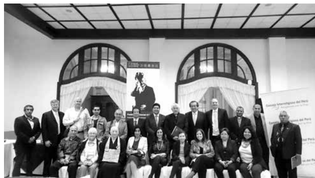
Entre los asistentes estuvieron representantes de todas las comunidades de fe en el Perú, así como líderes de las diversas bancadas.