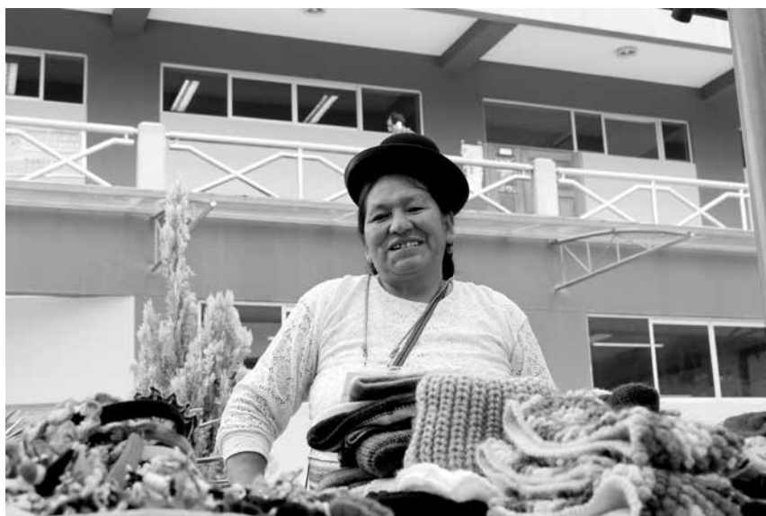
El Preforo recibió la visita de 450 delegados de 19 regiones del país. El evento tiene como fin articular propuestas de cara al VIII Foro Social Panamazónico que se realizará el próximo año en el Perú.

Todas las demandas de las mujeres en el Preforo hicieron ver que ellas sufren de manera particular los impactos de los problemas socioambientales. Todas coincidieron en que no visibilizarlas afecta de manera preocupante su vida pues no son consideradas en las políticas públicas