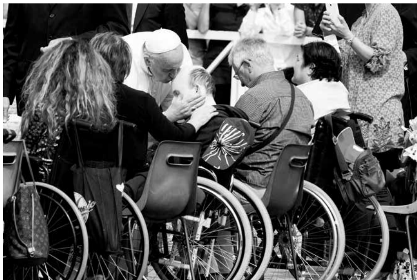
El Papa Francisco durante todo el año ha tenido signos de misericordia especialmente con los más vulnerables del mundo (pobres, mendigos, presos y enfermos).

El Papa, en la Bula de Convocatoria, expresó su deseo de que el pueblo cristiano reflexione en este año sobre las obras de misericordia corporales y espirituales, haciendo hincapié en la necesidad de despertar nuestra “aletargada conciencia ante el drama de la pobreza”, además de recordarnos que el Evangelio nos dice que “los pobres son los privilegiados de la misericordia divina”.