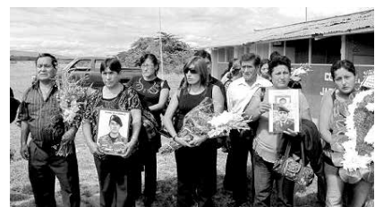
Los familiares de los policías se han agrupado para la consecución de la justicia que hasta hoy les ha sido esquiva.

Para ver esta entrevista, ingresar al canal de Youtube: https://www.youtube.com/InstitutoBC ■