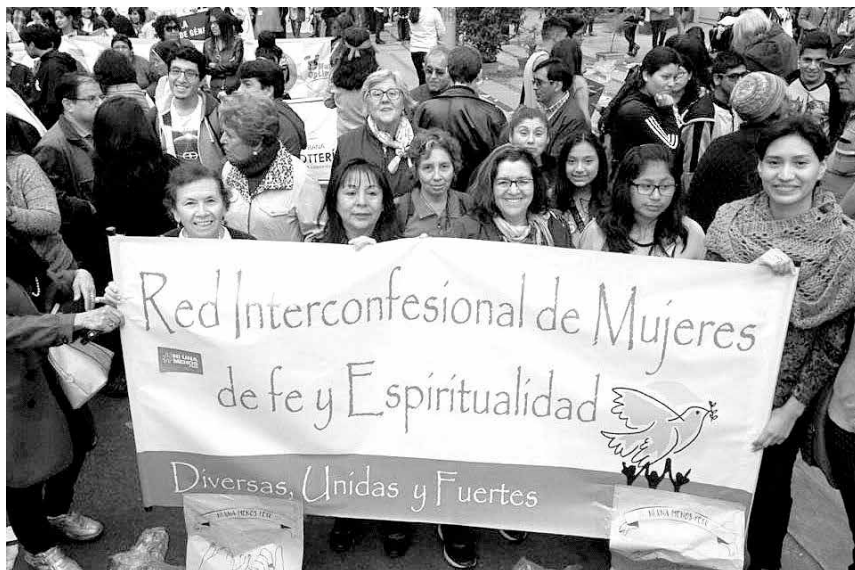
La Red Interconfesional de Mujeres de Fe y Espiritualidad se constituyó en octubre del 2003. Se encuentra formada por 21 integrantes delegadas de las diversas comunidades de fe. En la foto, integrantes de la Red.

La red Interconfesional de Mujeres de Fe y Espiritualidad se constituye como un espacio de encuentro para mujeres de diferentes confesiones. Sin embargo, dicho encuentro nace no de nuestras diferencias, sino por el contrario, de nuestras similitudes, desde aquello que tenemos en común. Es un espacio en el que apreciamos la diversidad, pero sobre todo la valoramos y respetamos profundamente. Puedo decir, entonces, que nos unimos y permitimos compartir desde tan marcadas y aparentes diferencias, gracias al sentimiento puro que nos permite trascender barreras, me refiero al amor. El amor por aquello que está más allá de todo lo que puede limitar la visión de quienes somos en realidad, aquello que no pasa por el color de nuestras pieles, las tradiciones o la cultura en la que crecimos, así como tampoco por las que fuimos educadas... es en lugar de ello, aquella fuerza que nos permite aceptar a cada una como es, sin discriminación. La Red es un espacio de inclusión, desde donde paradójicamente las diferencias también nos nutren y nos conducen por los cam-