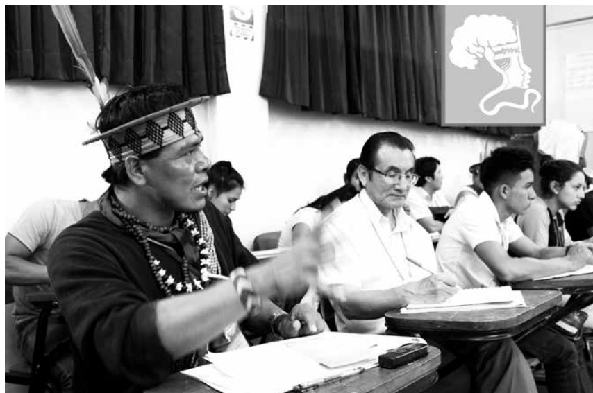
Es importante destacar los espacios de encuentro de la sociedad civil que permiten articular voces, agendas y propuestas de manera pública, y en particular el próximo Foro Social Panamazónico que se desarrollará en abril del 2017 (28,29 y 30) en la ciudad de Tarapoto.

En ese mismo sentido se constata que no hay una estrategia en cuan-