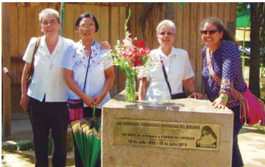
Soy la primera de la derecha y estoy junto con otras hermanas de mi comunidad. Celebramos más de 100 años de nuestra llegada a Puerto Maldonado. Lugar que nos desafía en nuestra vocación como misioneras.

Desde que llegué al Perú me inquieta la realidad, las problemáticas sociales que aquí acontecen. Hemos tenido la oportunidad de participar del espacio de formación para líderes en la Escuela Hugo Echegaray del Ins-