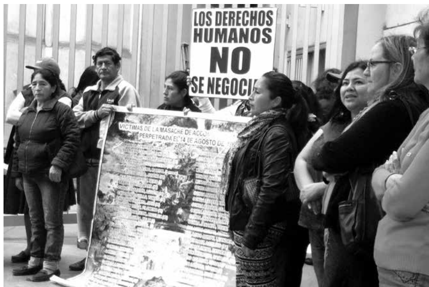
Durante el 2016 se han dado algunos avances como la judicialización de casos de graves violaciones a los derechos humanos. En la foto, familiares de las víctimas de Accomarca.

Junto a este caso debemos comentar también la sentencia condenatoria emitida en el mes de setiembre en el caso de los estudiantes de la Universidad del Callao desaparecidos en los Sótanos del SIE en 1993. Allí también el Poder Judicial terminó señalando la responsabilidad criminal de Vladimiro Montesinos y otros oficiales del Ejército en los crímenes sistemáticos perpetrados durante la peor época de la dictadura de Alberto Fujimori. De igual modo la sentencia dictada en el mes de octubre en el caso de la violación sexual de