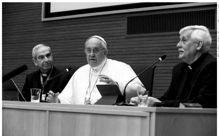
En octubre el venezolano Arturo Sosa fue elegido nuevo Padre general de los jesuitas y cerró la 36 Congregación general invitándolos a "ver este mundo con los ojos de los pobres". (En la foto el primero de la derecha).