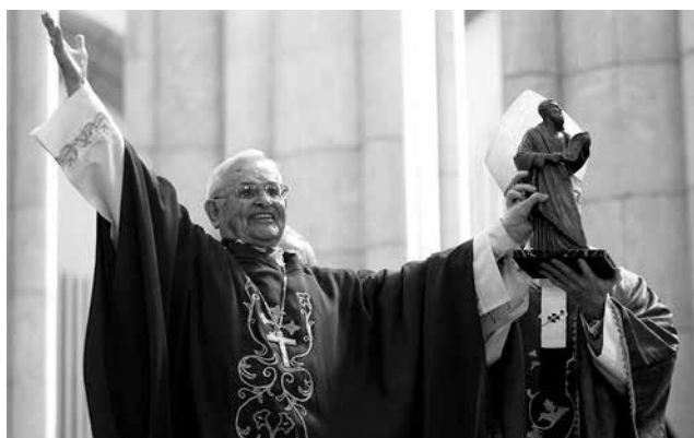
El cardenal Paulo Evaristo Arns, de Sao Paulo, es y seguirá siendo un ícono de la resistencia en los años de la dictadura brasileña (1964 -1985).

En la misma catedral de Sé, donde había lanzado sus gritos proféticos, sus restos reposarán como signo de una presencia que recuerda a la Iglesia que debe estar donde la vida clama y que no debe cansarse de denunciar toda injusticia. Su vida no deja de ser una buena noticia en nuestra Iglesia latinoamericana, Arns será recordado como pastor que no dejó de ser discípulo-misionero, pero sobre todo, será recordado como parte de la nube de testigos que confiesan a Cristo, el liberador. ■