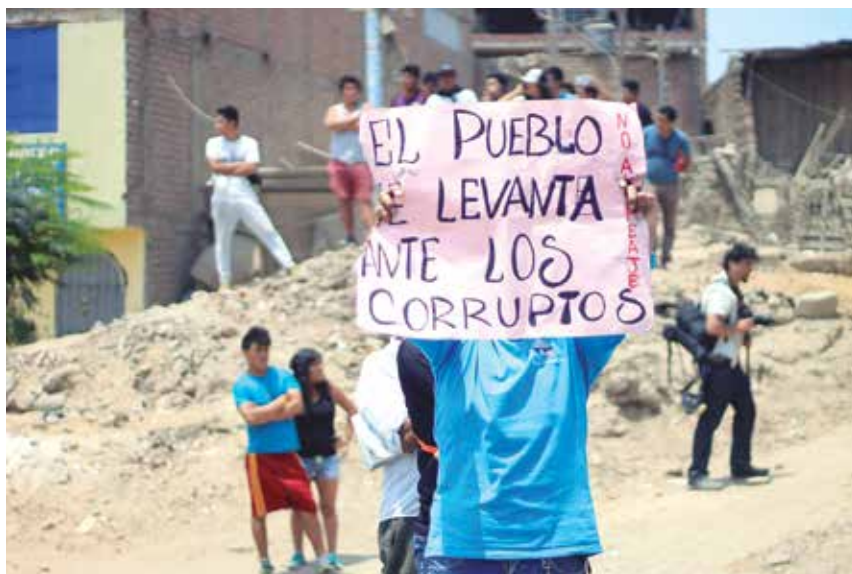
El impacto de ese mega-robo por parte de la corrupción se ha hecho ya sentir en nuestro país. Por ejemplo, en las protestas del 5 y del 12 de diciembre en Puente Piedra por el alza del cobro del peaje, a causa de los efectos de la corrupción de la empresa brasileña OAS y la Municipalidad de Lima.

En nuestro país hay otras obras donde Odebrecht participa, y donde pudo también haber coima, su modus operandi de hacer negocios. La empresa ha revelado que en efecto lo hizo con 29 millones de dólares (podrían ser más al final de las investigaciones), siendo investigados hasta ahora funcionarios de los gobiernos de Alejandro Toledo, Alan García y Ollanta Humala. Es decir, todos luego de la dictadura. Hasta el 23 de diciembre del 2016 se señaló que logró por contratos US $ 12, 534 millones ( El Comercio ), y a inicios del 2017 el Contralor General de la República ha señalado que el perjuicio asciende a US $ 319 millones, y que por ello hay en informes la indicación de presunción contra 150 personas (incluidos ex ministros y empresas), así cuáles fueron las normas que permitieron las irregularidades ( El Comercio , 20/01/2017). Hubiera sido ideal que lo dijera con claridad mucho antes. Odebrecht no sería la única en haber cometido serias irregularidades en el país. Otras que podrían ser investigadas y que firmaron también contratos son Gal-