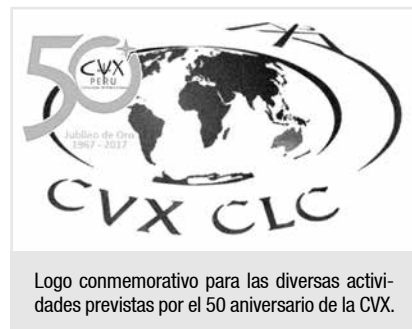
Logo conmemorativo para las diversas actividades previstas por el 50 aniversario de la CVX.

Empezamos con una eucaristía en acción de gracias, el día sábado 25 de marzo. Para el día jueves 30, tendremos un panel: “Dios trabaja así: 50 años de la CVX”, que tendrá lugar en el Auditorio de la Universidad Ruiz de Motoya a las 7pm. Y, para el sábado 1 de abril, de 7am a 5pm, en el Centro Asistencial Virgen del Carmen del Adulto Mayor, tendremos una jornada de misión. ■