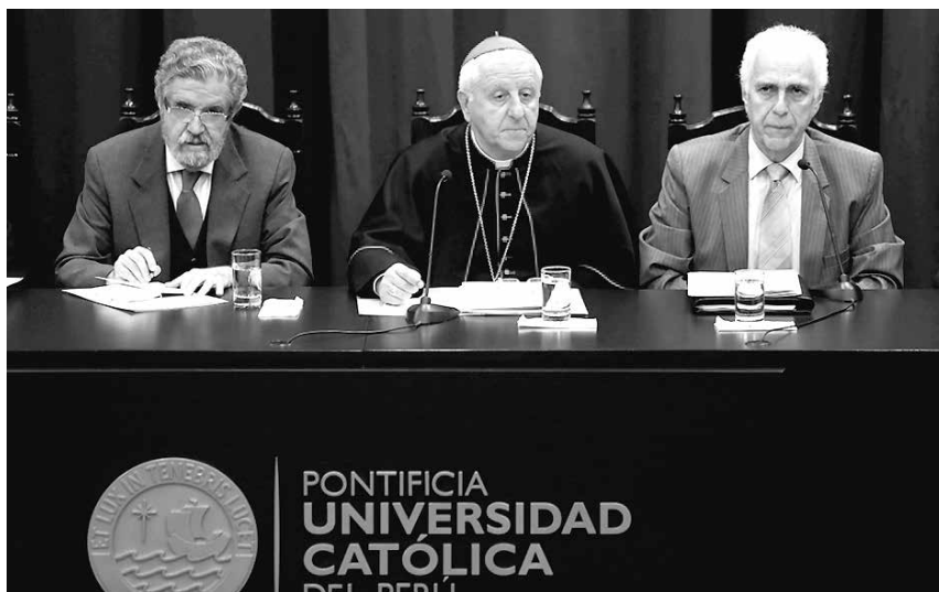
La Pontificia Universidad Católica del Perú llega al centenario de su fundación habiendo restablecido plenamente el vínculo con la jerarquía de la Iglesia católica. El cardenal Giuseppe Versaldi, prefecto de la Congregación para la Educación Católica, ha sido nombrado como Gran Canciller.

Adicionalmente, diversos actores y episodios de la historia de la PUCP ilustran el potencial del diálogo entre fe, razón y cultura: los círculos de reflexión de la Unión Nacional de Estudiantes Católicos, Gustavo Gutiérrez y la teología de la liberación, Manuel Marzal y los estudios sobre religiosidad popular, entre otros. En su centenario, quizás la tarea más urgente