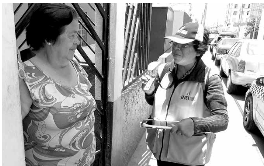
El próximo Censo Nacional de Población y Vivienda, que se realizará a mediados del 2017, será una herramienta muy poderosa para dirigir las políticas públicas, sobre todo hacia la población indígena, amazónica y afrodescendiente.

Nuestra campaña incluye elaboración de materiales (polos, volantes, llaveros, stickers, gorros, afiches,