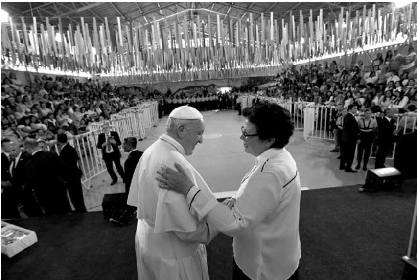
Francisco dejó huella, marcó a las sociedades peruana y chilena con su presencia. En Chile visitó el penal de San Joaquín de Santiago, que estuvo marcado por un diálogo emotivo, lleno de vida y esperanza.

por Ramiro Escobar, analista internacional y profesor universitario.