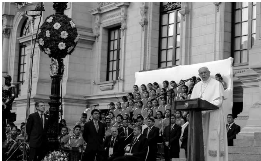
La política bien entendida consiste en ocuparse de los asuntos públicos, los de todos, en especial los de la gente sencilla, que necesita más apoyo público y oportunidades. Lo dejó claro en su visita al Palacio de Gobierno frente a la clase política del país.

Pero entendamos, lo que resulta común a la corrupción es la normaliza-