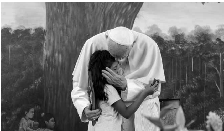
La visita del Papa llega en un momento clave en una región marcada por diversos dramas, pero donde aún hay una esperanza viva, y definitivamente son los niños y jóvenes sus mejores custodios.

En este contexto, estos pequeños se han convertido “en los descartables” sobrevivientes de todos los males que sufre esta región. Por ello no deja de ser alentador que el Papa los haya visitado, y que no sólo Madre de Dios sea conocida por la deforestación, la