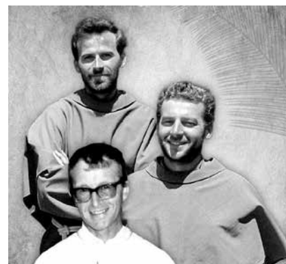
Los últimos mártires beatificados (P. Alessandro Dordi y los sacerdotes polacos de Pariacoto) son ejemplos de santidad en la entrega y compromiso por una vida más justa.

Para declarar un mártir tradicionalmente se hacía mención al odio de la fe, eso habría que volver a reentenderlo. Porque no se trata tanto de odio a la fe sino de odio a una determinada práctica y una determinada manera de vivir, que es el caso de los mártires de Chimbote. El problema ahí no es tanto un odio a la fe sino no estar de acuerdo con una determinada práctica, porque piensan que va en contra de los principios que ellos tienen. No es solamente odio a la fe sino odio a la justicia, odio a la verdad. Los cristianos estamos con el pobre, pero en contra de la pobreza, y eso supone una práctica, un gesto. ■