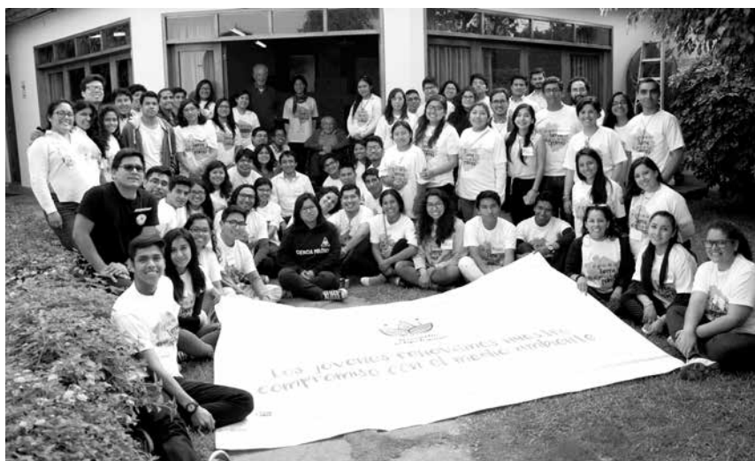
Jóvenes de todas las regiones se reunieron el 9 de diciembre en el local del Instituto Bartolomé de Las Casas, institución que junto al Observatorio Socio-eclesial de la Universidad Antonio Ruiz, propiciaron este espacio de diálogo y propuestas sobre la problemática ambiental.

Haciendo eco del llamado del papa Francisco en la lucha por la defensa del medio ambiente, jóvenes de todas las regiones del Perú se reunieron el 9 de diciembre en el local del Instituto Bartolomé de Las Casas, para reflexionar desde la carta encíclica Laudato si' , y proponer compromisos y demandas en torno a las problemáticas ambientales de cada región. Asistieron jóvenes de San Martín, Pucallpa, Ayacucho, Chiclayo, Puno, Cusco, Ancash y Arequipa, sumando en total más de 20 participantes. Y de parte de la región Lima, participaron unos 50 jóvenes que están vinculados a organizaciones en defensa del medio ambiente, así como trabajando en la reflexión teológica sobre esta problemática.